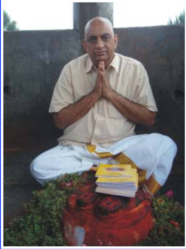
తిరుమల నారాయణగిరి శ్రీవారి పాదాల వద్ద శ్రీచరణామృతం ప్రథమ ప్రతికి పూజ చేస్తున్న చిత్రం