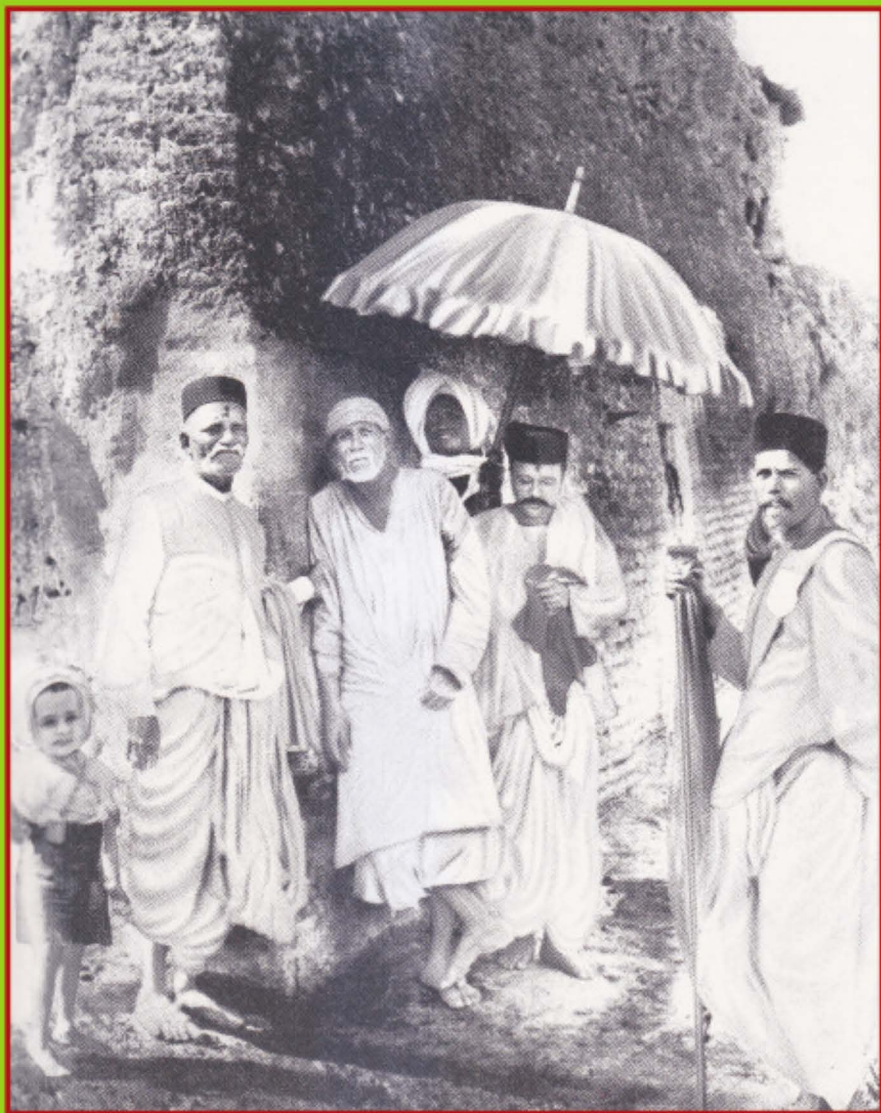
ఓం ఆత్మరూపాయ విద్యహే యోగీరాజాయ ధీమహి తన్నో సాయి ప్రచోదయాత్